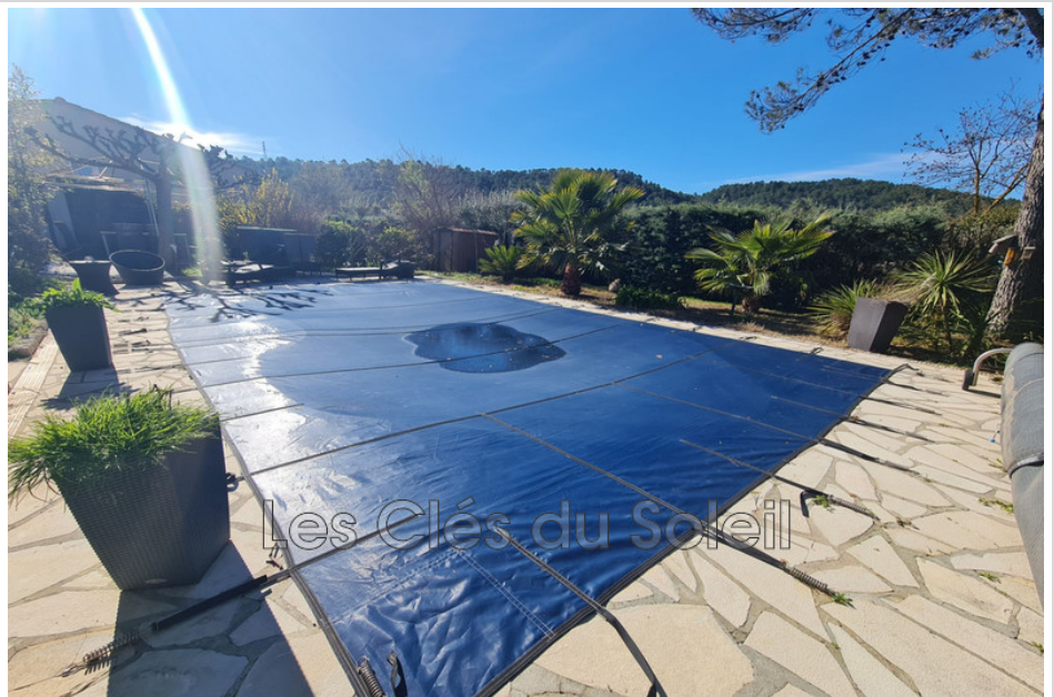
Villa 12884 Le Val

Le Val, Au calme calme, sur un magnifique terrain de plus de 1600 m 2 , villa T5 de plain-pied partiel. Avec studio. piscine . Abri auto. Composée d'un salon séjour avec cuisine US aménagée et équipée, cheminée avec insert, agréable véranda exposée plein sud, 3 chambres, un grand dressing, salle de bains, WC indépendant. Une dépendance composée d'une pièce principale, salle d'eau avec WC. Piscine 8X4 avec pompe à chaleur, Cabanon de 19 m 2 et une serre de jardin. Réserve d'eau de 10 m 3 (récupération des eaux de pluie). Vaste jardin paysagé et possibilité de garer plusieurs véhicules avec un carport. Les CLES DU SOLEIL BRIGNOLES 04 94 37 11 03